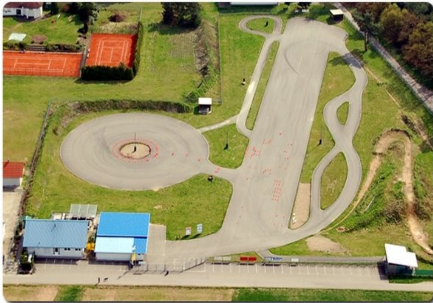
AMC-Kronau Motorrad – Sicherheitszentrum